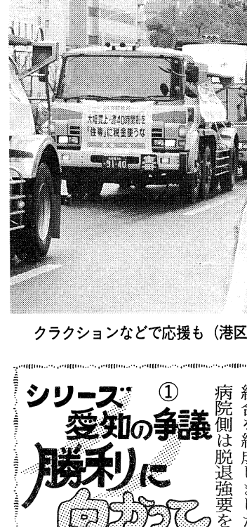
クラクションなどで応援も (港区藤前→中区三の丸へ)