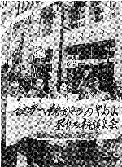
東海銀行へ「母体行は責任をとれ!」

「住専処理に血税を使うな」「母体行が責任を取れ」と二月九日、国民大運動愛知県実行委員会は、昼休み抗議集会を栄小公園にて行いました。集会には、三百人余が参加し、母体行の一つである東海銀行本店に向けてデモ行進。行進終了後、「母体行と政府大蔵省が責任を」と東海銀行・東海財務局に申し入れました。