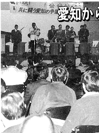
音楽家ユニオンは音楽で自己紹介

二月十六日、名古屋市教育館で、四月二十日に行われる「紡ぐ春の集い(第三回国鉄フェスタ)」の企画として「夢!元氣!春を紡ぐ!共に闘う愛知の争議交流集會」が行われ、会場は、いっぴいの人と熱気であふれました。集會では、十三本にも及