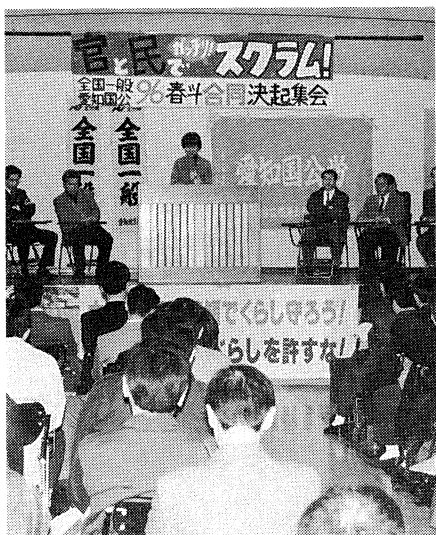
確信に満ちた報告が続きます。

や社保負担負担の変更など大きく前進(全国一般)」「自らの大幅賃上げをめざして共同行動に参加してきたが、全組合員による団体交渉など貴重な体験もできた。今年は、人事院への要請署名など民間の協力もお願いしたい(愛知国公)」など積極的に評価。さらに多くの組合員が参加できる