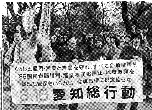
しめくりは、怒りをこめて県経協へデモ行進

労働者・国民の状態悪化と 要求実現へのたたかう決意の高まり 春闘アンケートや職場・地域での「総対話」運動で示された労働者の生活と労働の実態は、不況や円高を