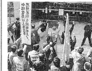
山場を迎えた中電争議 (2・16昼休みデモ)

日経連は一月の総会で、「賃上げゼロ」を宣言しましたが、財界・大企業の一部から公然と異論がだされ足並みが「みだれ」ているのが96春闘前半の特徴となっています。また、要求の低いのが残念ですが、連合の一部幹部のなかからも頑張る決意が表明されつつあります。これらは労働者・国民の怒りと要求、そして大幅賃上げこそが不況打開のキメ手であり、大企業の労働者・国民や中小企業に対する「痛めつけ過ぎ」への批判であ