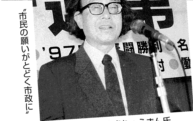
「市民の願いがごとく市政に」