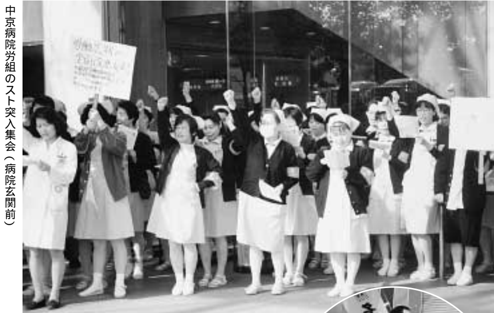
中京病院労組のスト突入集会(病院玄関前)