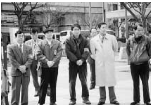
決起集会で紹介。名古屋工場分会のストに入る仲間たち(名古屋駅西口広場で)