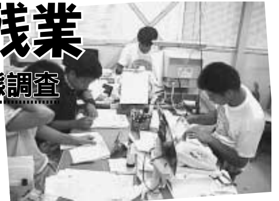
配送が終わってから また 仕事

あなたの職場ではサービス残業があたり前になっていませんか。仕事が忙しく毎日残業だが、残業代がつけにくい。そんな雰囲気職場にありませんか。 「働きがい、心のゆとりをなくす長時間労働をなくそう」と、名勤生協労組青年部ではサービス労働実態調査をもとに、秋から本音でサービス残業について話し合う取り組みをすすめています。