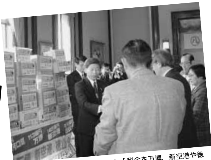
3月19日市民の願いが詰まった「税金を万博、新空港や徳山ダムに使うことのぜびを問う」直接請求署名を手渡す市民投票を実現する会の代表。3月26日松原市政とオール与党は、十分な審議もせず否決。