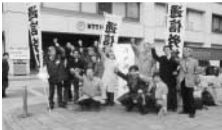
通信労組は2カ所でスト突入集会と宣伝行動 国公の仲間も激励の宣伝を

「あんな騒がしいクラスで勉強ちゃんとしてくれるですか」父母の不安な声や子どもたちの荒れた様子に、心痛まない教師はないと思います。現場の苦悩に比べ、名古屋市の教育行政の怠慢はひどいものです。教員の新規採用数の減少で、職場の高齢化が顕著と