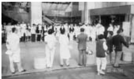
中京病院のストライキ突入集会(玄関前) 看護婦増員の訴えには患者さんも激励