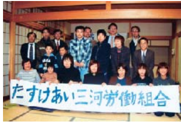
激励に駆けつけた仲間たちと

12月26日夜、たすけあい三河労働組合が結成大会を開き、自治労連と岡崎・額田地域センターへの加盟を決定しました。 同組合は、岡崎市福岡町にある「たすけあい三河・グループホーム舞」で介護の仕事をしている仲間たち