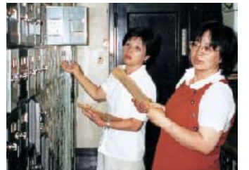
市役所の交換箱を通して職場へ

「みんなの手をつないで頑張らなくっちゃと元気になる新聞に」と。その紙面はかわらかい手書き文字、工夫された見出し、そして豊かな記事からは仲間たちの思いが伝わってきます。