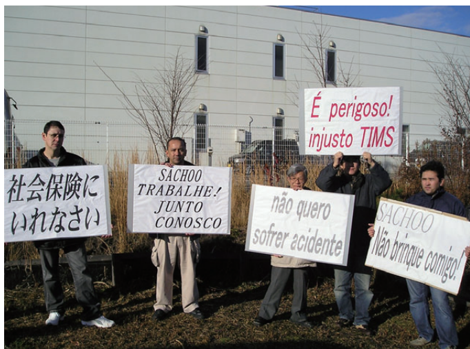
会社前での宣伝ではポルトガル語のポテッカーをかかげて

「世界のトヨタ」がある豊田市内の保見団地。ここは居住者の半数近くが外国人です。JMIU愛知支部は豊田市内でこの間、定期的