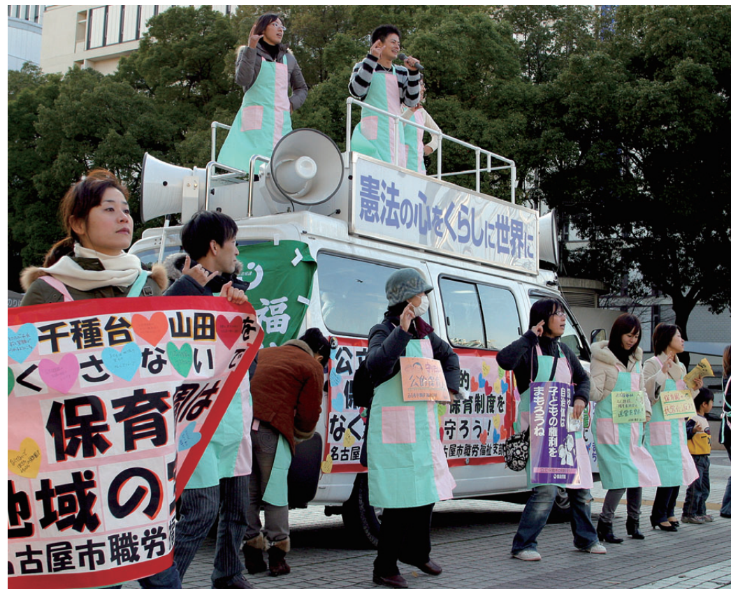
パフォーマンスも交え元気に、公立保育園のはたす役割と大切さを訴え宣伝行動

長谷川 最初、「保育園が廃園され民営化されるのが良い」とか悪い「かもよく分からない」という声が多かったです。苗代保育園での説明会では、市当局