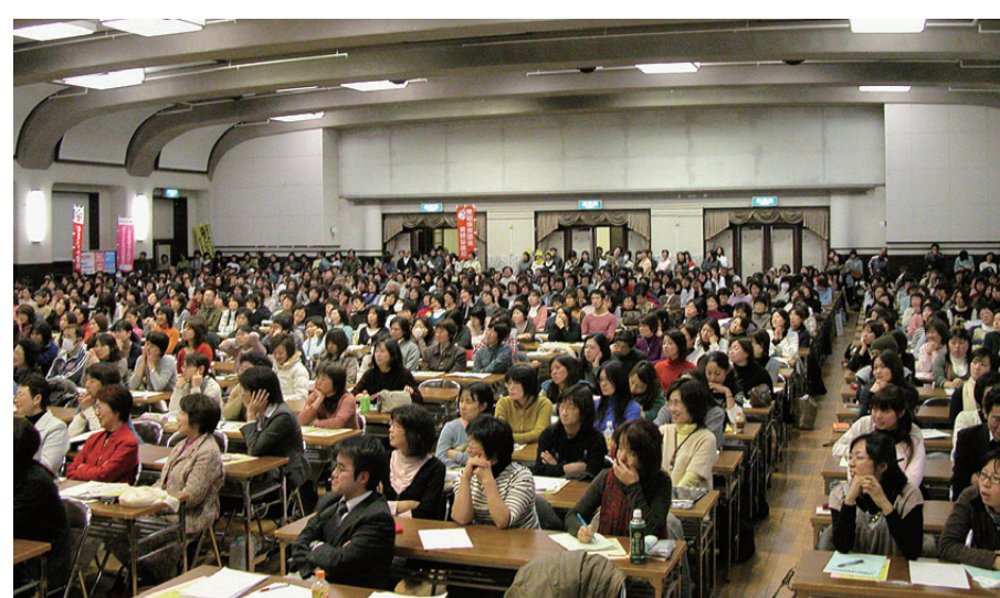
会場を埋め尽くした「公立保育所の民営化は許さない!12・14大集会」

局が「床暖房になる」とか「ランチームができる」など、良いことばかり言うという質問が出たときに何も答えず、保護者からは「悪いことを何一言わない」といわれる声が寄せられていました。しかし12・14大集会やいるんな人たちの応援もあり、廃園ではなく公立のまま運営をすすめていくという声が増えてきています。