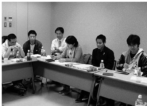
会議に集中する実行委員の仲間 ■実行委員会のブログ「たてよこ」 http://blogs.yahoo.co.jp/zen_toho

3月30日、全労連東海北陸ブロック08サマーセミナーの第1回実行委員会が岐阜県でおこなわれ、6県から19名の実行委員が集まりました。サマーセミナーは青年要求の2大テーマである「学習と交流」を大切にしながら今年で16年目となります。会議の冒頭では、そうした歴史や意義・目的について意見を出し合いました。昨年の開催地である三重の青年からは「開催してみてもサマーセミナーの効果を実感し