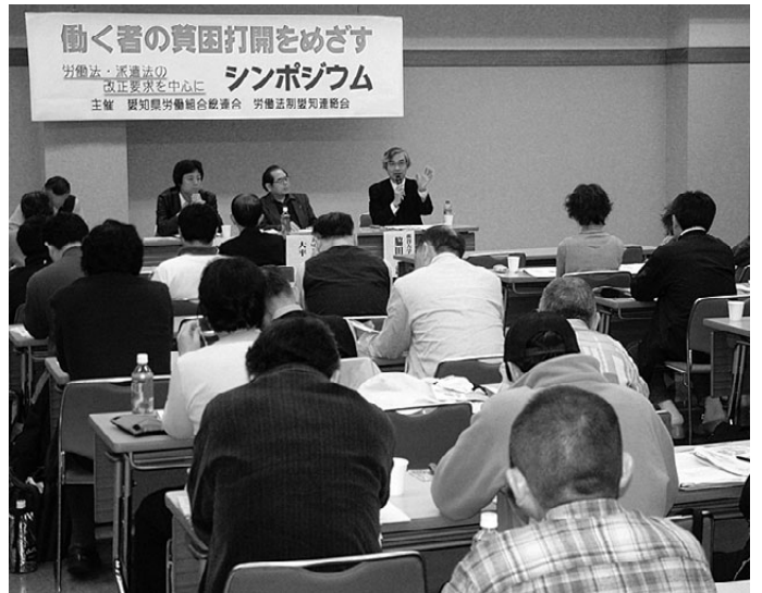
働く者の貧困打開をめざすシンポには100人が参加(3/24)

労働契約法が3月から、改正パート労働法が4月から施行されました。両法とも、労働者の権利保障にはほど遠い内容ですが、それでも運動を反映した改正部分もあり、これらを生かしたとりくみが重要になります。