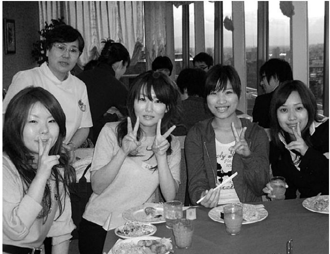
国共病組名城病院の歓迎会に集まった新人の仲間たち

4月1日から新人職員への加入呼びかけが一斉に始まりました。今年は昨年の倍、数倍もの加入を成功させる組合が続いています。 国共病組名城病院では病院側の妨害があり、夕方からの歓迎会のチラシ配布もできませんでした。しかし、役員がプラカードを持って「おめでとうございませぬ。12階レストランで歓迎会のお食事をします。」とみんな来てね。」と明るく元気に呼びかけ、24人の新人が歓迎会に集まってくれました。先輩職員も20人が参加、当日だけで17人が加入しました。 同じく、このところ新人職員の組合加入が少なく、大幅に組合員を減らしてきた大病院。役員が「どう訴えたら新人のみんなに気持ちが届くか」と話し合いを重ね、説明会を準備。なんと当日だけで85人が加入。組合員が一気に増えました。 本庁職場での加入が減っていた豊川市職労では、昨年の合併を機に組合加入に力を入れてきました。説明会では委員長に続き、青年が加入の呼びかけ。一人ひとりが必ず「加入書に記入してください」ときっちり声をかけ、一人をのぞく全員が加入しました。 瀬戸市職労の説明会でも若手役員が「住民の権利を守るためには自分たちの権利も守らなければ」と訴え、岩倉市・長久手町・豊橋市民病院でも全員加入を実現しました。 福保労は5月11日の新人歓迎会までに700人地本を目指して奮闘。年金者組合も仲間づくり月間に突入し、組織拡大月間が本格的に展開されています。