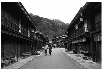
08年1月20日に妻籠宿にて撮影