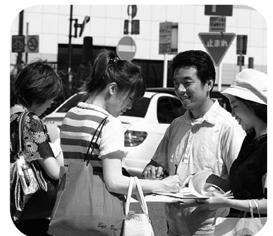
憲法改悪反対共同センターが呼びかけた、2回目となる全県いっせいの日宣伝は67カ所を超える駅頭などでとりくまれた

この秋には反貧困や生活危機突破を掲げた取り組みが続きます。10月には燃料高とたたかう集会も開催されます。様々な団体と「つながり」を大きく広げましょう。