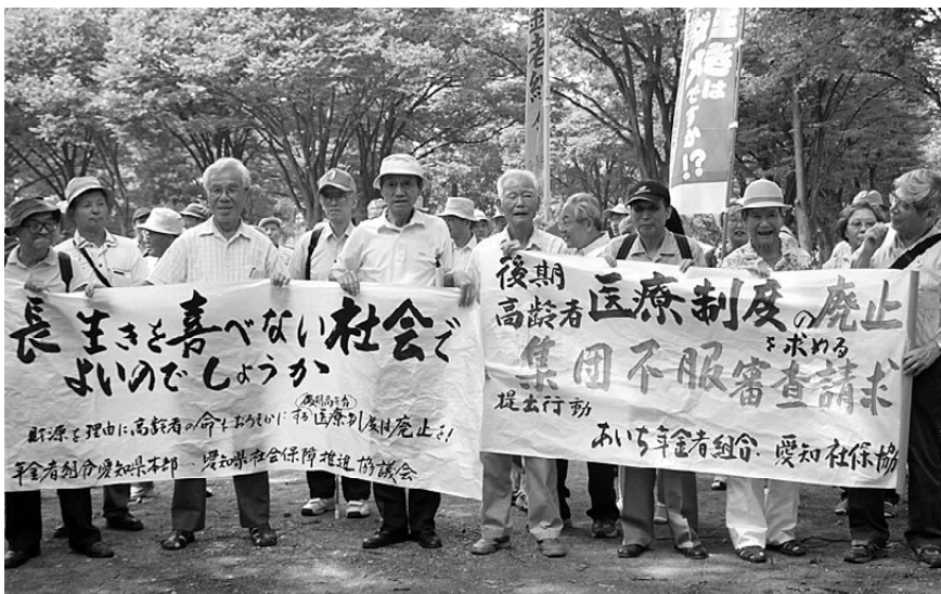
年金者組合と社保協が後期高齢者医療制度で集団不服審査請求 (8/20)