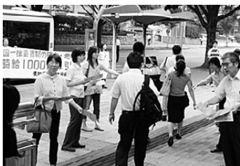
大幅引き上げを求めて宣伝(8/26)