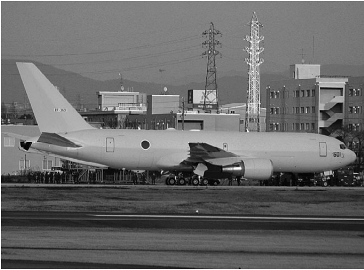
小牧基地に現在2機配備されている空中給油輸送機 (KC767J)