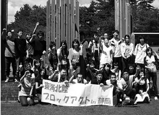
アクトに集まった仲間とハイチーズ

8月30(土)~31日(日)、静岡県立森林公園にて医労連・東海北陸ブロックアクト(青年交流集会)が開かれました。38名が集まり、愛知からは7名が参加しました。 初参加の青年が多く、最初のクイズや学習会ではみんな猫をかぶっていました。深夜まで(一部は日の出を拝むほど)の班交流で、日頃はできないような 仕事や組合活動、恋愛などの悩みを深く話し合い、最後にはすっかり打ち解けて、来年の全国アクト(山梨で会おう!)と約束し合いました。やっぱり相談できる仲間がいるっていいですね! 雨で予定していた天体観測やウォークラリーは行えませんでした。が、体育館でおこなったドッジボール大会に、二日酔い本気になり、二日酔いも吹き飛ばして汗を流しました。 愛知の青年どおしの新たな繋がりがもて、「スポーツ企画をしたい!」とか「心身の健康チェックやうつ病への対応法の学習会『平和&グルメツァー』」などの希望が出ました。 今後これらの企画案を実行に移して、青年のつながりを、もっと広めていきたいです。 10月にはアフターアクト交流会を企画しています。医労連以外の方も歓迎します。どしどし参加してください! (医労連青年部発)「アフターアクト交流会」のご案内 10月11日(土) 18時30分 10月11日(土) 18時30分 10月11日(土) 18時30分 10月11日(土) 18時30分