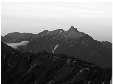
2008年9月2日、燕岳から槍ヶ岳・穂高岳を望む 文・写真 市場丈規(あるきですとの会代表)

夏山の雑踏も9月の声を聞くとき、静かな山が帰ってくる。それを待って、北アルプス燕岳に。登山口からはいきなりの急登