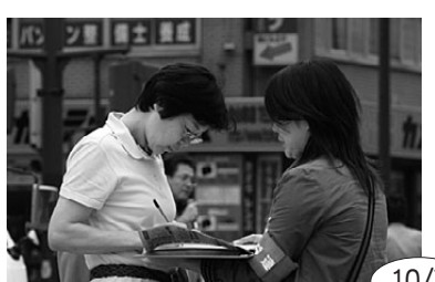
労働法制連絡会と愛労連は派遣法改正を求める宣伝行動を実施。市民の関心も高く署名に応じる姿が目立った

みんなのとくみ お寄せください 単産・単組や地域でのとくみを写真(デジタルでも可)と簡単な文章でお寄せください。しめきりは毎月4日までに愛労連事務局必着。詳しくは... TEL 052-871-5433(竹内)まで E-mail post@airoren.gr.jp