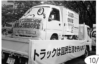
「STOP! 燃料高騰 なくせ貧困 交運労働者決起集会」には約100人が参加。政府に燃料高騰の対策を要求