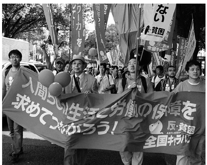
フェスタ終了後に栄公園までパレード

知フェスタが開催され、模範店やフリーマーケット、焼き出し、バンド演奏などが行われました。フェスタは生活保護や多重債務者の支援を行う市民団体などが中心になって実行委員会を結成。弁護士会、司法書士