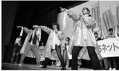
保育ネットの元気なパフォーマンス

9月23日、名古屋市中区役所ホールで「語りたいたいがある 伝えたい思いがある」をテーマに「要求満載 実りの名古屋」要求交流集会を名古屋革新市政の会が開催しました。団体・