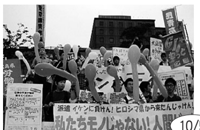
まともに生活できる仕事を!と開かれた全国青年大集会には4600人が参加。愛知からも130人が駆けつけた