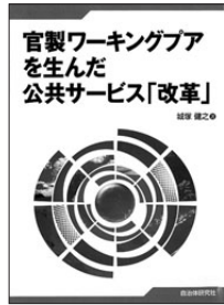
官製ワーキングプアを生んだ公共サービス「改革」 城塚健之 [著] 自治体研究社 定価1,900円+税

公務・公共サービスは、いま「指定管理者制度」「市場化テスト」「PFI」などの手法で「官から民へ」とすすまじい勢いです。さすんでいる。こうしたなか、「官製ワーキングプア」と言われる人が急増。本書は民営化の