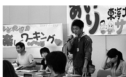
2日目のシンポの様子

自分の生活がなくなっていく日常を振り返りました。三重のフリーターの青年は、ハローワークで見つけた職場が求人票と違っただけでなく、解雇されそうになり、青年ユニオンに入会。自分の要求をきちんと伝え、納得のいく離職ができた体験を語りました。報告を受けて参加者は9つの班に分かれて討論。「納得できない」と思っている組合員が「知識がない中では『仕方ない』と思わされてしまう」「家庭を持つたらこんな働き方はできない」と、労働組合の大切さや「人間らしく生き生きと