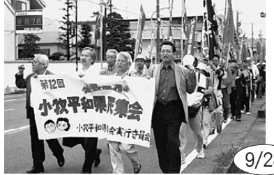
第12回小牧平和集会には500人が参加。空中給油機配備など基地機能強化の動きに小牧市長からもメッセージ