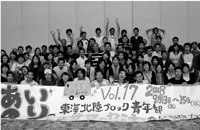
東海北陸7県から仲間が集まり元気を分け合いました