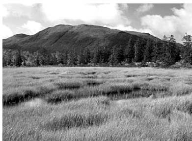
2008年10月2日にニセコ・神仙沼にて撮影 文・写真 市場文規（あるきですとの会代表）

北海道ニセコ、数ある湖沼群にあっても最も神秘的で美しいと讃えられる神仙沼。10月2日、草紅葉の湿原を求めこの地を訪れた。