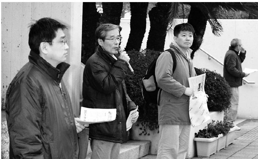
小牧市への陳情後、市役所前で宣伝をする文化シャツター支部の仲間(2/17)