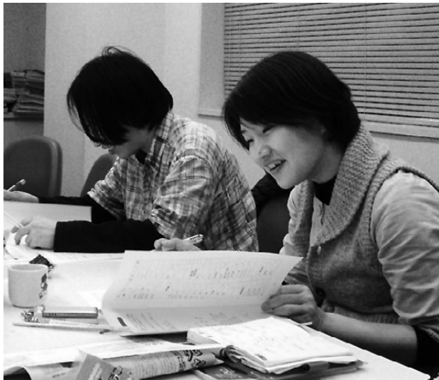
楽しく調査票を記入する青年協の幹事

愛労連青年協は、定例会議のなかで時間をとり、「最低生計費調査集中とりくみ日」として幹事全員で書き込み作業をおこないました。 幹事会7人の中でも単身者はわずか1人。親元から通っているか、夫婦共働きで生活を維持している青年が愛労連の中でも多数を占