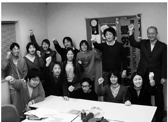
「がんばるぞ〜」とガッツポーズの実行委員

2月16日、イブニングメーデー第3回実行委員会が開かれ6団体から15人が集まりました。 イブニングメーデーは、昨今の青年の労働実態、雇用状況の厳しさをとらえ、昨年からの民青同盟と愛労連青年協の2団体で準備をすすめてきた「愛知青年集会」です。5月16日に東京でひらかれる「全国青年大集会2010」は「就職先が見つからずに自分を責める学生がたくさんいる」と報告。青年協の代表は「泣き寝入りをしてはいけない、世の中を変えたいと青年が立ち上がり始めている」と話しました。 2団体の共同呼びかけ文に賛同した「愛知県学連」「うたごえ協議会」「平和委員会青年学生部」「青年ネット（革新・愛知の会）」の団体が実行委員会に参加し、来月の開催に向けて様々な意見を出し合っています。 愛知県学連の学生は「就職先が見つからずに自分を責める学生がたくさんいる」と報告。青年協の代表は「泣き寝入りをしてはいけない、世の中を変えたいと青年が立ち上がり始めている」と話しました。