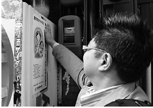
2.25地域総行動では商店街にポスター貼り