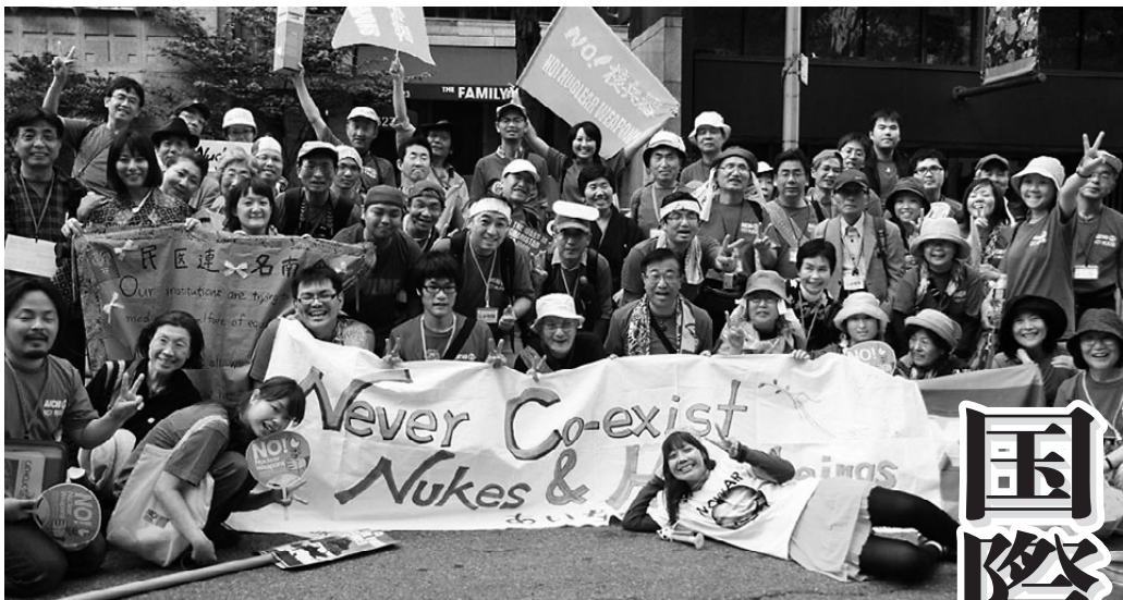
マンハッタンでのパレードを終えた愛知の代表团 (5/2)

「核兵器廃絶の国際交渉開始合意を今回のNPT再検討会議で」と5月2日、ニューヨークのマンハッタンに1万人が結集。日本から1500人、愛知からも130人以上が参加しました。