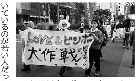
LOVE&ピンポールのパレード

つながれば変えられる 快晴となった4月25日、名古屋市中区内の鶴舞公園普通記念壇でおこなわれたイブニングメーデーには県下の様々な労働組合・団体や県外からの個人参加者など2000人の青年が集まりました。勇壮な太鼓演奏やジャズ・ロックなどのパフォーマンスを交えたのち、イブニングメーデー集会が開かれ、全国青年大集会実行委員会を代表して全労連青年部書記