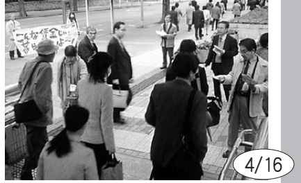
最低賃金引き上げを求め早朝宣伝。毎年恒例のハンガーストライキは来月6月17日に実施