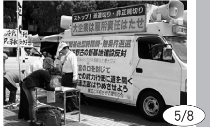
憲法と平和を守る愛知の会が毎週定例の土曜日宣伝。普天間基地撤去の署名に若い人の反応が目立つ