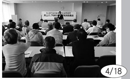
賃下げ・下請け守る愛知県決起集会には60人が参加。集会後にはトヨタ総行動での下請けアンケート結果を配布