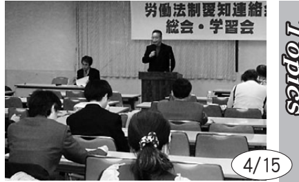
労働法制愛知連絡会が総会と学習会を開催。今後、財界が狙う労働者の働き方について学ぶ