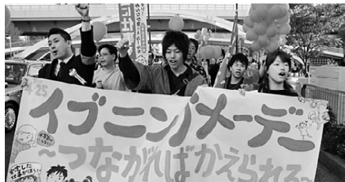
米の繁華街を元気にパレード