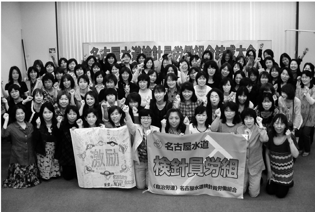
「力を合わせてがんばっていきましょう」と検針員労組結成大会に集まった仲間たち