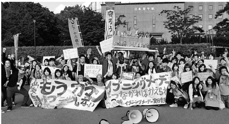
「変えるぞ〜」とガッツポーズの参加者

5月16日、東京都内の明治公園で全国青年大集会2010が開催され全国から5200人、愛知からは110人が参加しました。集会の前には「派遣・非正規、医療、保育、女性、平和」など様々な分科会が