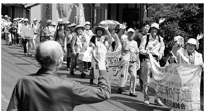
豊橋市内の東海道二川宿で声援を受ける行進団(5/31)