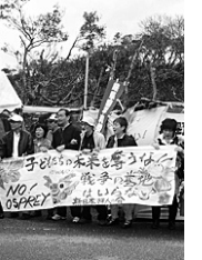
東村・高江で新ヘリパット建設に抗議

安倍自民党内閣は、沖縄・普天間基地の移転先として名護市辺野古への「移設」に固執しています。嘉手納以南の基地返還という宣言が先行していますが、「沖縄における在日米軍施設・区域に関する統合計画」(13年4月)で、米軍はあくまで代替施設の確保が前提だと主張しています。