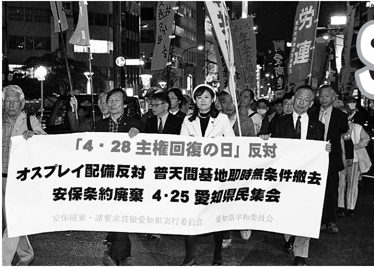
「主権回復の日」を認めない愛知県民集会でデモ行進