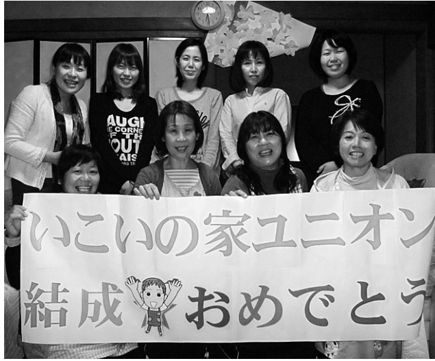
結成大会に集まったいこいの家ユニオンの仲間たち

3月からスタートした春の組織拡大月間は、最終月に入り各組合での奮闘が続いています。