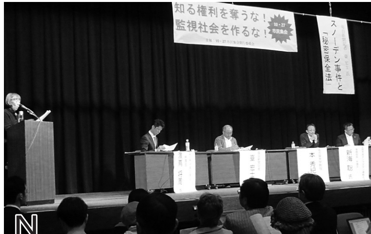
「知る権利を奪うな! 監視社会を作らな! 10.27市民集会」は、弁護士や民主団体、個人が400人が集結