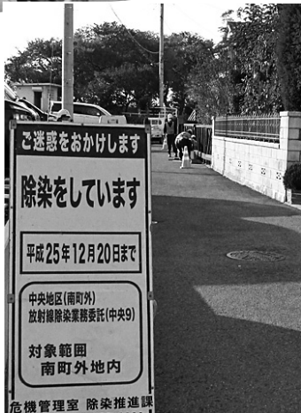
デモコース脇で除染作業