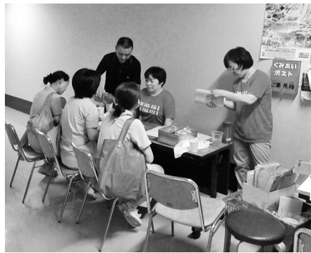
退勤時調査をする全医労豊橋支部