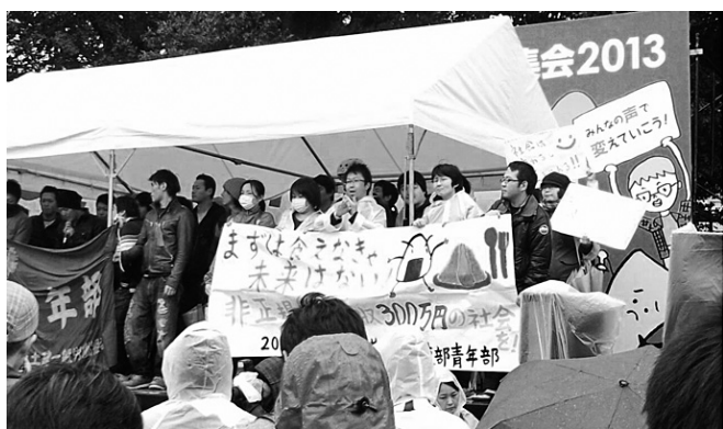
「食えなげや未来はない」と訴える青年

雨にも負けず全国から1500人今年で8回目となる「全国青年大集会2013」が、10月20日に行われまし