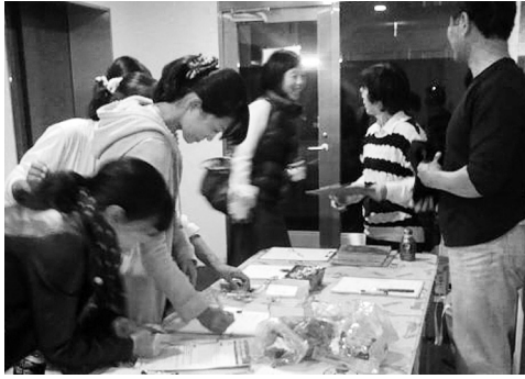
退勤時調査をする南医療生協労組