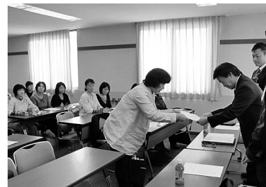
要求書を渡す執行委員長

印刷業界は1991年の総出荷額をピークに毎年右肩下りの状況が続ぎ、働くルールも守られないような通販印刷の台頭でさらに厳しさを増しているのが現状です。 そんな中、東海共同印刷労組は、11月6日の14秋闘統一回答指定日に、第一回目の団体交渉を行いました。これまでも継続して春闘、秋闘時には正規、非正規の仲間の要求を掲げて闘っており、執行部からの統一