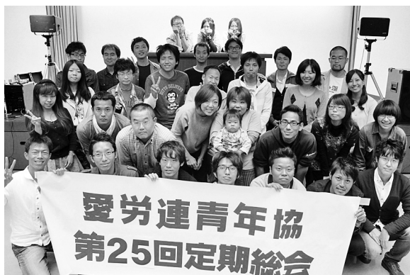
愛労連青年協 第25回定期総会