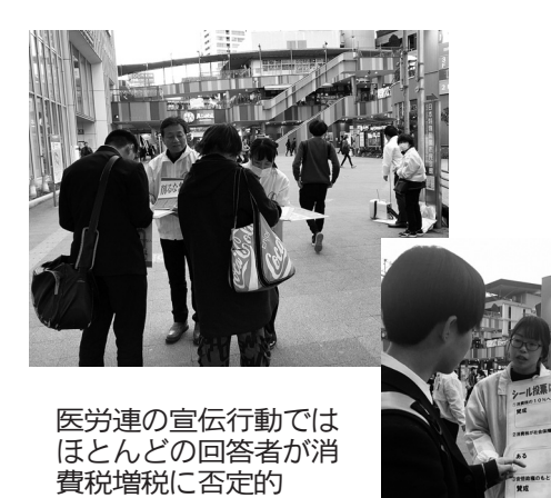
医労連の宣伝行動ではほとんどの回答者が消費増税に否定的

さびに家計に追い打ちをかける消費増税10%への増税はぜったいストップ 消費増税などで可処分所得が減少し続ける中、食料品など物価値上げ、更に10月に消費増税10%への増税では今までの暮らしが維持できなくなります。 医療費の窓口負担、本来減るはずでは？ 社会保険の財源として導入された消費増税ですが、導入は全く違っています。消費増税導入前後の医療費の自己負担額や健康保険料の推移からも消費増税が社会保障に使われていないことは明らかです。 共同を広げて10月の増税ストップ