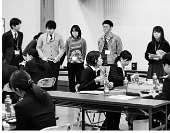
27人が加入した 蒲郡市役所での説明会

さあ、新たな仲間を迎えよう！ 春の組織拡大月間が始まり、4月の新規採用者の加入にむけて各組合でとりくみが進められています。 ①コープあいち労組ではパート職員への働きかけで、「労組入りませんか？働くルールカード」を毎月配布してよびかけをおこなっています。②医労連は合宿で新人100%加入へ向