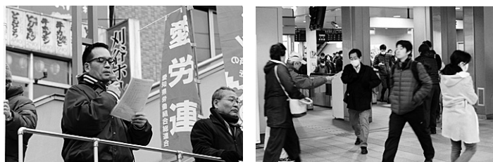
2月11日は各地で行動。刈谷駅での早朝宣伝(上2枚) トヨタ自動車本社前(下左)、東三河労連が豊橋市内と田原市内でチラシ配布(下右)