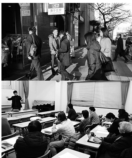
④千種名東労連の早朝宣伝、⑤名中センターは夜の行動で水道法改正を学習

全県から結集し 春闘勝利に声上げよう 3月14日には名古屋市中区栄の栄小公園で全県労働者決起集会とデモ行進をおこないます。粘り強く戦い続け大幅賃上げ、労働環境改善など要求実現を前進させましょう。