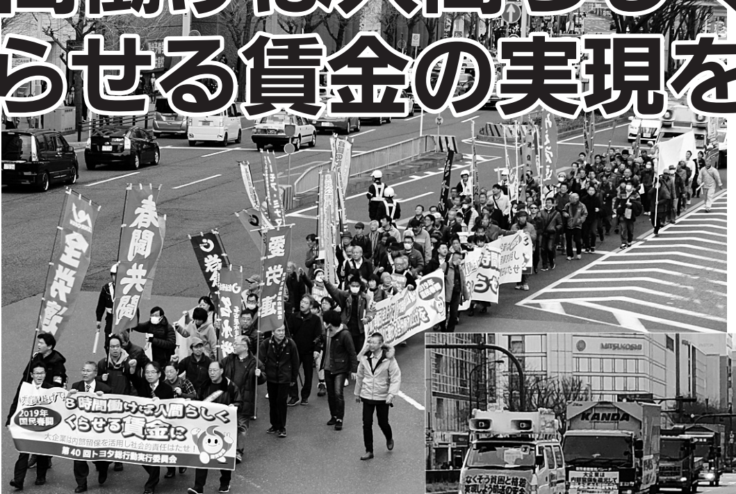
④トヨタ総行動で名古屋駅周辺をデモ行進 ⑤愛知自動車デモで約50台が沿道にアピール

2019春闘は山場を迎え、愛労連の各組合は春闘勝利にむけてとりくみを進めています。3月13日を集中回答日とし、翌14日にはストライキを含む統一行動などを配置して、団体交渉を精力的に進めています。「8時間働けば人間らしくくらせる賃金」の実現にむけて、職場・地域で要求実現に全力を挙げていきましょう。