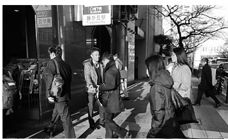
④千種名東労連の早朝宣伝、⑤名中センターは夜の行動で水道法改正を学習

要求実現にむけて妥協せず 粘り強くたたかおう 19春闘は全国的に3月13日を回答指定日としていきます。団体交渉の結果によって、7日には文化シャッター支部でもストを決行。福保労は全国一斉に14日行動予定日とし、スト権を確立。医労連もスト配置の構えを見せつけています。 JMITUは川本製作所支部が3月5日に団交決裂を受けての2時間の時限スト、7日には文化シャッター支部でもストを決行。福保労は全国一斉に14日行動予定日とし、スト権を確立。医労連もスト配置の構えを見せつけています。