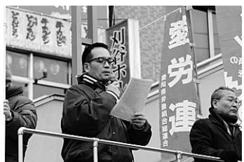
2月11日は各地で行動。刈谷駅での早朝宣伝(上2枚) トヨタ自動車本社前(下左)、東三河労連が豊橋市内と田原市内でチラシ配布(下右)