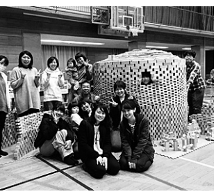
豊橋市での積み木ワークショップ交流

けてシナリオを実践学習して意思統一。③建交労では年間3000人拡大を目標に、学童保育支部や保育パート支部でとりくみを準備。④さすなは30人を目標にとりくみ、知多支部では労働相談も計画しています。