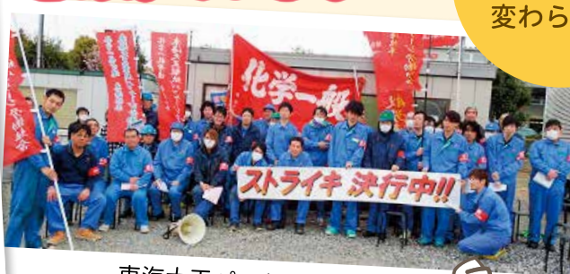
東海大王パッケージ労組 ストライキ(豊橋)

組合はひとりで入れます。2人いればつくれます。 だからひとりでも多くの仲間に 組合に入ってもらいたいです。