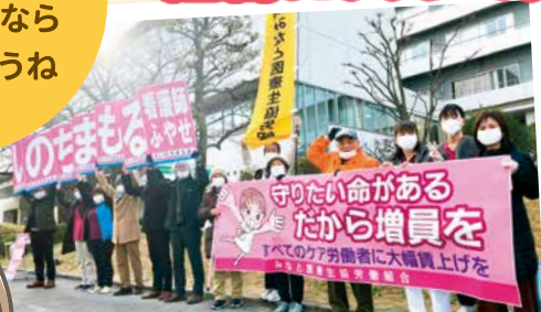
賃上げ・増員を求めストライキ (みなと医療生協労組)