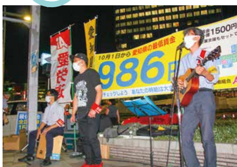
最低賃金引き上げアクション(名駅)