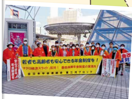
年金の引き下げに反対