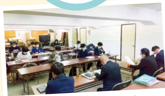
労働組合だからこそできること 要求書を出して団体交渉(名南会労組)