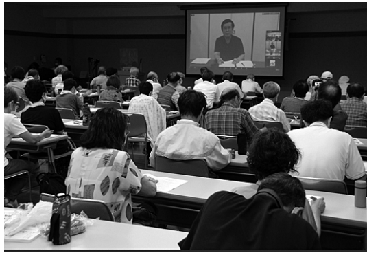
安倍首相の辞任のタイミングに重なり、注目度が高く大勢の参加者が詰めかけた。会場からは熱心な質問や意見も出された