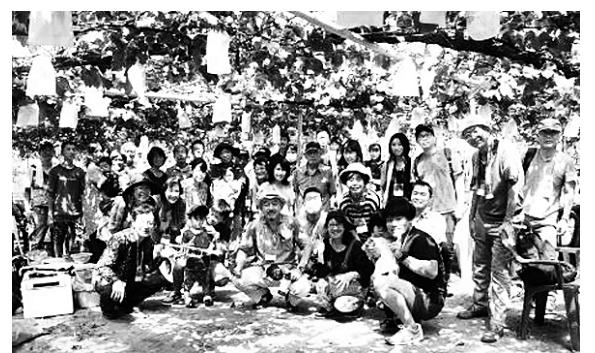
東浦町でのぶどう狩りには50人以上が参加。多くが家族で参加し、楽しみながら対話が弾んだ。まずは楽しくつながりづくり