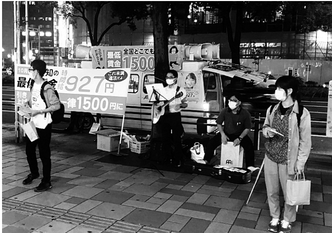
音楽演奏やラップ調のコールで通行人の注目を集めたことでシールアンケートへの多くの協力につながった