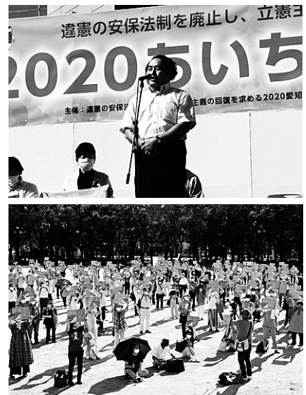
9月19日、名古屋市中区・白川公園での「安保法制を廃止し、立憲主義の回復を求め2020あいち集会」で700人の前で政府の問題を指摘

何より選挙権は行使しないのもつたいない。もともと納税と引き換えに与えられたものですから。主権者として払った税金の使途を厳しく監視するために、必ず投票に行くということが大切です。