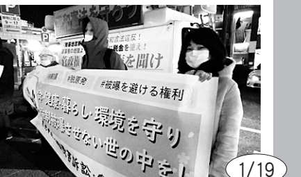
1/19 金山駅南口で「あいち総がり行動」の宣伝行動。同時刻に栄や名古屋駅でもとりくまれた