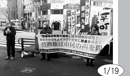
1/19 金山駅北口での9の日宣伝。コロナ禍での行政権の誤りを指摘し、医療など社会保障にお金を回せなどと訴えた