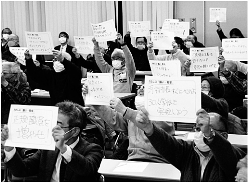
2月4日の革新市政の会「要求交流決起集会」では参加者全員がそれぞれの名古屋市政に対する要求を掲げてアピール

2月4日、労働会館東館ホールで革新市政の会が4月25日投票の名古屋市長選挙に向けた要求交流・決起集会を開催し、会場に85人、インターネットで100人を超える視聴があり200人近くが参加しました。