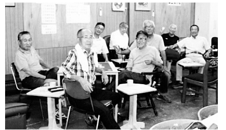
①未来の年金者のためにも年金裁判。②サークルは生きがい