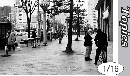
1/16 憲法と平和宣伝。軍事費をコロナ対策に回せなどを訴えるとともに、改憲に反対する署名もとりました