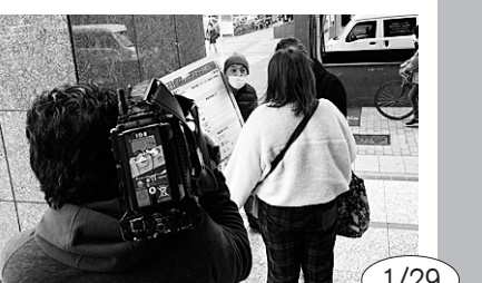
1/29 第8回目となるハローワーク前での調査行動で生活が苦しいと75%の人が回答。様子はテレビでも報道された

みんなのとりくみ お寄せください 単産・単組や地域でのとりくみを写真(デジタルでも可)と簡単な文章でお寄せください。しめきりは毎月4日までに愛労連事務局必着。詳しくは... TEL 052-871-5433(小松)まで E-mail post@airoren.gr.jp