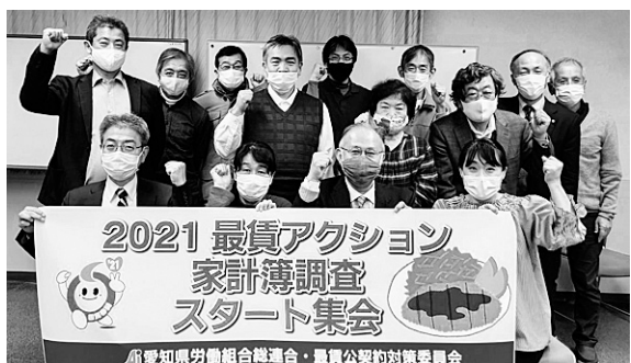
会場でもリモートでも「最賃引き上げがんばるぞ」

次長が行動提起。「若者が自立した生活を送るためには年間300万円は必要。今の最賃では月270時間、つまり1日9時間、休みなしで働かなければなりません」と述べ、最賃を引き上げ、雇用を安定させる必要性を訴えました。その上で次の行動を提起しました。①家計簿調査を通じて今の最賃の低さを実感する。②全国一律最賃制度、最賃1500円の実現に向けて宣伝や署名行動に参加する。③職場や家庭で最賃の問題点を伝える。④最賃未達の求人を見たら、お店