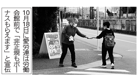
10月18日(土)愛労連は労働会館前で「非正規もボーナスもらえます」と宣伝

10月24日、「選挙代行」論を乗り越えて「責任」論を乗り越えて社会を変えていこう、そんな対話をすすめていこう。総選挙が終わり、「政治を変えよう」との訴えは十分に浸透できず、「現状よりも悪くならないでほしい」の気分にとどまったのかもしれない。今回「共通政策」と「政権構想」という柱が立ち、四野党は「政権交代」を掲げた。気候変動やジェンダー平等を争点に押し上げたこと、これは確信にしたい。来年は参院選。社会は変わるし、変えられる。労働者と国民のたたかひによって変えられる。このことを心にとめたいです。(KT)