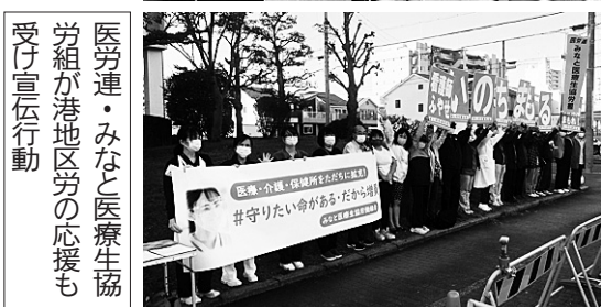
医労連・みなと医療生協労組が港地区労の応援も受け宣伝行動