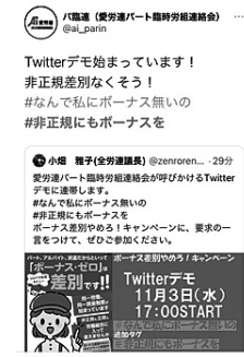
ツイッターデモ①と金山駅北口スタンディングデモ

「元気になる集会」終了後は「ボーナス差別NG」をツイッターデモと金山駅北口でのスタンディングデモとなりました。 「非正規にもボーナスを」ツイッターデモ