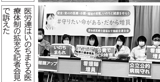
医労連はいのちまもる医療体制の拡充を記者会見で訴えた