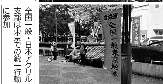
全国一般・日本アクリル支部は東京での統一行動に参加