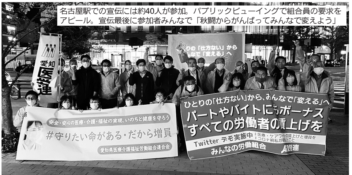
名古屋駅での宣伝には約40人が参加。パブリックビューイングで組合員の要求をアピール。宣伝最後に参加者みんなで「秋闘からがんばってみんなで変えよう」