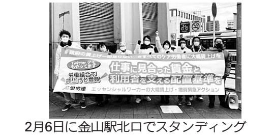
2月6日に金山駅北口でスタンディング

全国的にケア労働者の賃上げが求められる中、愛労連は1月14日にケア労働者を含めたエッセンシャルワーカーの賃上げ・増員をめぐり「エッセンシャルワーカーの賃上げ・増員緊急アクションプロジェクト」を発足しました。22春闘では公務も民間も、全てのエッセンシャルワーカーの賃上げから、全労働者に波及するよう要求実現にむけて運動を進めます。