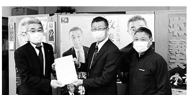
牧義夫 衆議院議員(立憲民主)