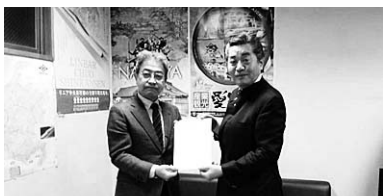
神田憲次 衆議院議員(自民)