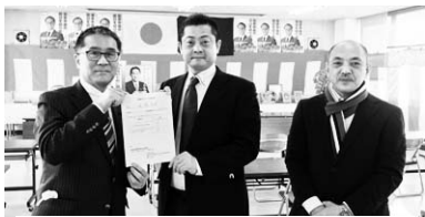
伊藤忠彦 衆議院議員(自民)

これまでの運動を確信にして声上げよう 春闘方針の提案で、竹内事務局長はこれまで20年以