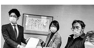
武田良介 参議院議員(共産)