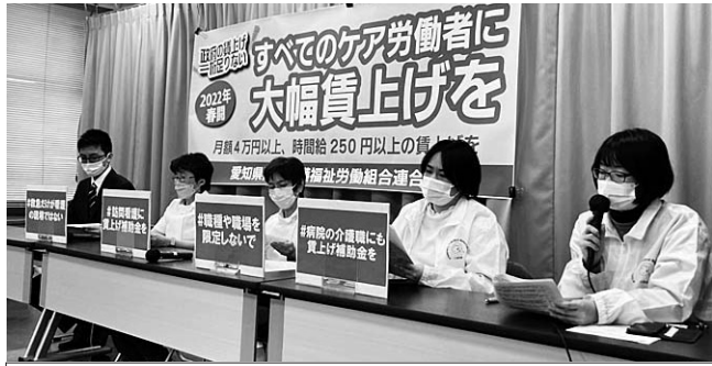
多くのマスコミに医療・介護労働者の実態を訴えた

エッセンシャルワーカーの賃上げ・増員から、すべての労働者の賃上げにつながる22国民春闘。愛労連はプロジェクトチームを立ち上げ、賃上げ・増員の実現にむけて関係単産と協力して、実態アンケートなど取り組みを進めています。関係5単産では、徐々に成果