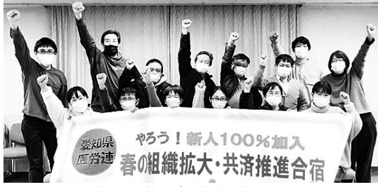
医労連の組織拡大共済推進会議。リモート参加もあり、参加者全員でしっかり意思統一

春の組織拡大月間(3月5月)にむけて、特に職場に多くの新人が入ってくる4月に多くの新人を労働組合に迎え入れようと、各組合が入念に準備・意思統一をおこなっています。