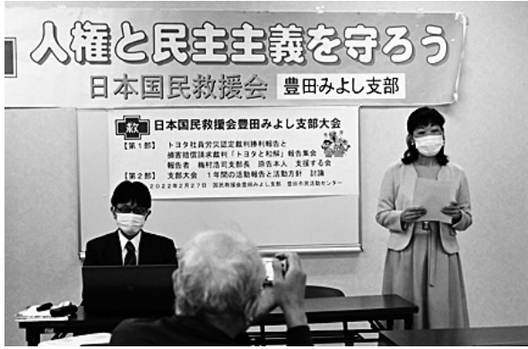
国民救援会豊田・みよし支部総会内での報告集會。被災者の遺族の方も参加し、支援への感謝を伝える

この高裁判決後、損害賠償請求訴訟については、トヨタ自動車から訴訟外での和解の申し出があり、4回の協議を重ね、2022年1月27日に全面的な和解が成立しました。