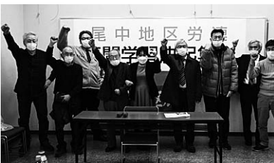
尾中地区労連は学習決起集会