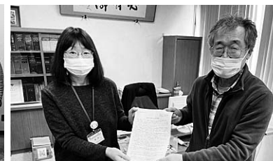
尾東労連のハローワーク要請