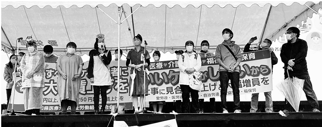
第93回愛知県中央メーデーで賃上げ・増員の実現に向けて決意表明する「愛労連エッセンシャルワーカーの大幅賃上げ・増員プロジェクトチーム」の仲間たち

■とき 6月11日(土) 13時開場 13時半開会 ■ところ 労働会館東館2階ホール