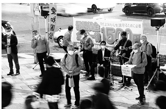
まん延防止措置が解除された名古屋駅は人通りも多く、「最賃1500円」への反応も良かった

求める「愛労連署名」がメインにとりくまれます。愛労連最賃・公契約対策委員は今年度の引き上げ額について「最低でも1000円を実現しなければならぬ」と今後の愛労連署名のさらなる推進を呼びかけます。