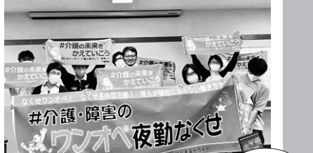
5/15 障害・介護職場のひとり夜勤をなくす「なくせ」プロジェクトが署名とアンケートの学習会を実施