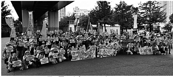
6月4日のピースアクション

5月31日に愛知県入りした平和行進。あいち平和行進は4年ぶりのリアル行進に元気にとりくみ、6月11日に岐阜県に引き継ぎました。午前中は名古屋市内各区分で進行がとまり、午後には1400人が参加し、「核兵器なくせ」「大軍拡・増徴反対」のピースアクションがおこなわれた。 平和行進は8月の原水爆禁止世界大会へと続きます。世界大会も大きく成功させ、核兵器のない平和な世界に歩みを進めましょう。