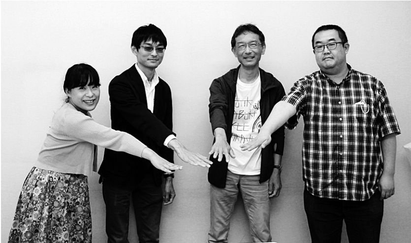
ゆにきゃん座談会で学んだことを再確認。今後は自分の職場でなかま増やしがんばろうと誓い合う座談会参加者

■と き 7月23日(日) 9時30分開場 10時開会 ■と ころ 日本ガイシフォーラム・レセプションホール JR東海道線「笠寺」駅より徒歩5分 (名古屋市南区東又兵衛町5丁目1番地の16) ※お弁当1100円(要事前注文)