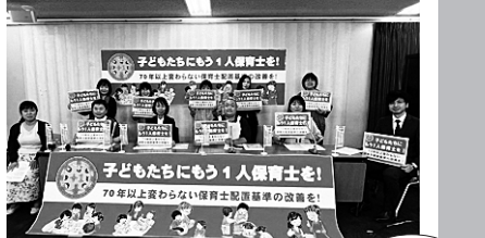
5/17 愛知発の「子どもたちにもう一人保育士を！」の中で全国保護者実行委員会が発足し、厚労省で記者会見