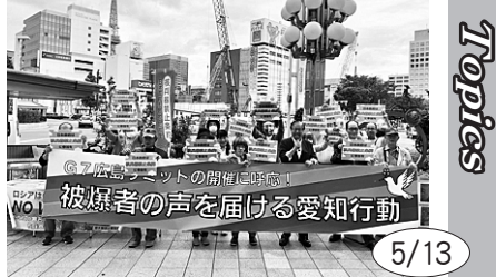
5/13 広島でのG7サミット開催に呼応して、「愛知県民の会」が宣伝行動。岸田政権のサミットに臨む姿勢を批判