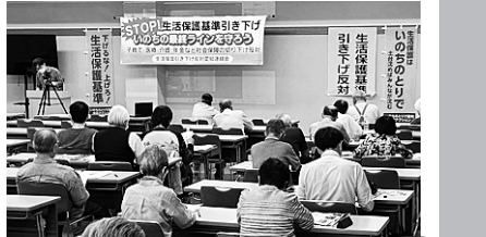
5/20 生活保護基準引き下げ反対裁判愛知連絡会が総会。名古屋高裁での勝利にむけて今後の活動などを意思統一