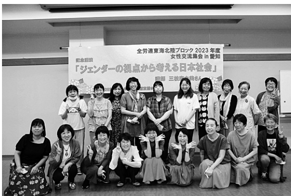
ジェンダー平等実現にむけてみんなでがんばろう

6月24日、「全労連東海北陸ブロック女性交流会in愛知」が労働会館東館ホールで開かれました。東海・北陸の各県から、会場・リモートを含めて合計31人が参加しました。