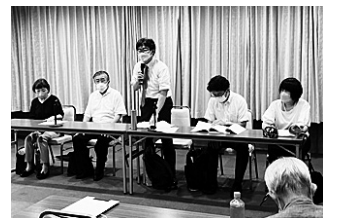
判決後の報告集会