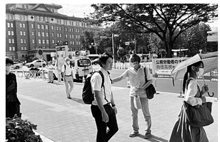
7月7日の三の丸での宣伝行動。最賃と合わせて「民間の賃上げを公務員賃金にも」と訴えた

場となります。7月11日には、中部プロアップの世論喚起とともに、愛知県や名古屋市の人事委員会への申し入れもおこな