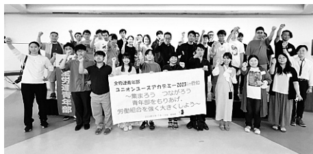
①2日目終了後の記念撮影。②集まるとやっぱり楽しい。深夜の3次会まで盛り上がった交流会

5人から始まった名古屋リハビリ事業団労組、今春の3人加入で4倍の20人になりました。今後も仲間増やしをがんばります。