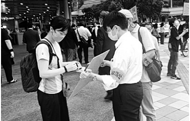
①最賃審議会に積まれた署名と労働者委員(奥)。②最賃サマーアクションのシールアンケートは大盛況

愛労連は6月29日、愛知労働局へ最低賃金1500円などを求める署名を提出しました。従来の手書き署名は9479筆、今年から新たにとりくんだオンライン署名は1348筆を第1