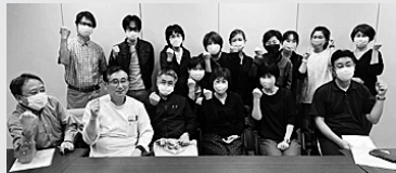
名古屋リハビリ事業団労組 (医労連)

4月11日、初めて組合説明会をおこないました。新入職員だけでなく、既存の職員にも労働組合を知ってもらい、加入してもらおうとしたところ、3人が新たに加入してくれました。 以前は、組合説明会はおろか、組合加入を呼び掛けることも積極的ではありませんでした。変わるきっかけとなったのが、看護師が6人同時に退職したことでした。増員を求めると、職員としての交渉では結果が出ず、労働組合で交渉しようという試みでした。パワハラや残業、年休、「やめたい」と思うことがあるか」など