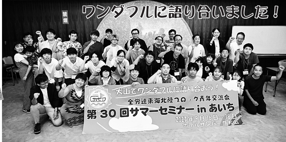
④全日程終了後に記念撮影