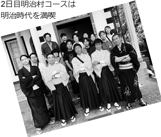
2日目明治村コースは 明治時代を満喫