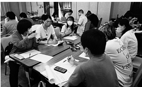
3日目全体会は時事問題ついて、自分たちの考えをワンダフルに語り合った