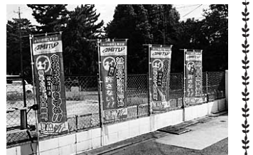
問題とされたのぼり旗