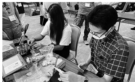
1日目はサマセミ30回記念ロゴなどで缶バッジやエコバッグづくり