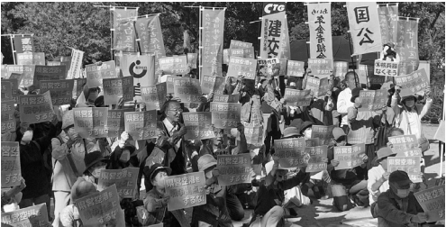
小牧平和県民集会