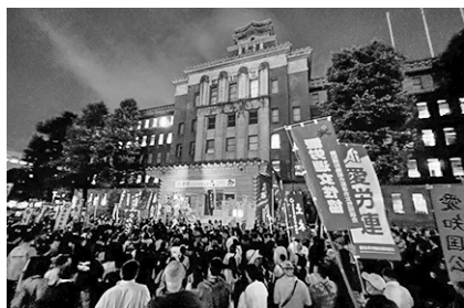
名古屋市職労と港職労の集会