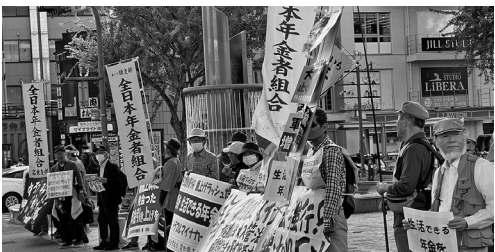
名古屋年金者一揆

10月30日、年金者組合愛知県本部主催の名古屋年金一揆が行われ、約100人が参加しました。