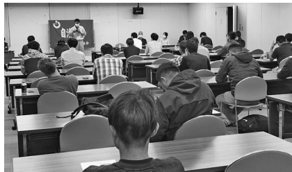
豊橋市職労の集会