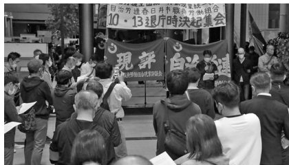
春日井市職労の集会