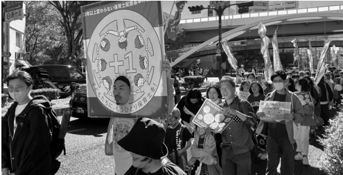
福祉削るな！愛知県民集会

また、障がい者向けグループホームが食材費を過大請求していた問題では「障がい者の暮らしを支える福祉に金儲けはそぐわない」と発言がありました。