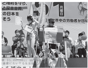
昨年のコンクール表彰式の様子

デコレーションコンクールなど、誰でも楽しく参加できる企画もあります。物価高騰で苦し