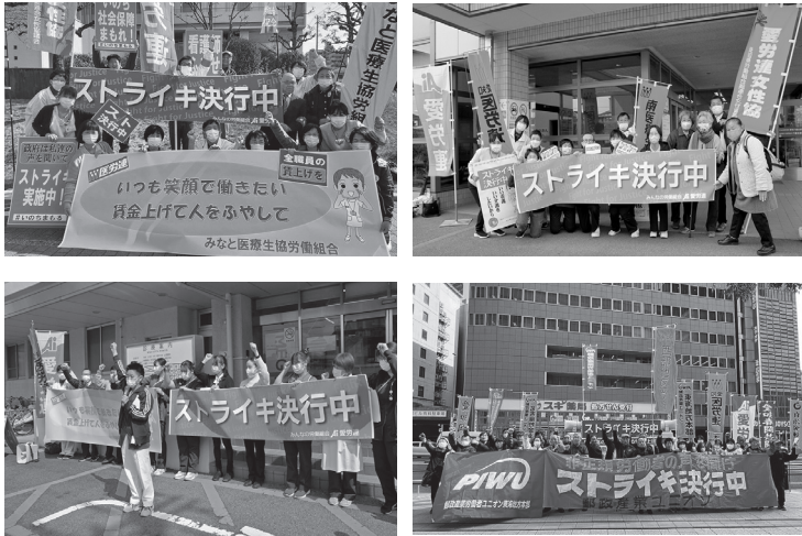
ストライキの様子 ①左からみなと医療生協労組、南医療生協労組 ②左から名南会労組、郵政産業労働者ユニオン

愛労連は「たたかう労働組合のバージョンアップ」を掲げ、ストライキを背景に高い交渉力を持つ回答を引き出すことを提起しています。 3月14日、JMIITU