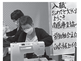
南医療生協労組 白衣裾上げ会

好評でした。名古屋市職労では、4月1日から職場の先輩が声掛けする事が大切だと思いつながっています(左上 ニュース)