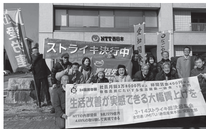
④ JMITU 川本製作所支部2回目ストライキ ⑤ JMITU 通信産業本部NTT前宣伝