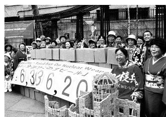
2015 年 NPT 再検討会議時

2015年の会議開催時には日本から1000人以上の代表団を派遣し大パレードや現地平和団体との交流をおこないました。当時の参加者は、平和運動の中心を担い活躍しています。平和の運動を未来へ繋ぐためにも是非若い世代を送り出してください。世界では核兵器廃絶を求める国が多数で、日本の考え方が少数派であることを現地で肌で感じてほしいです。